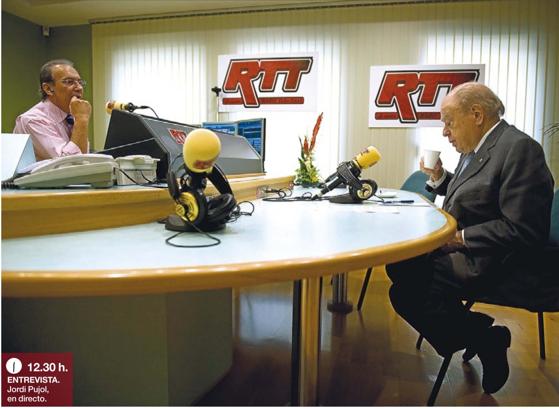
12.30 h. ENTREVISTA. Jordi Pujol, en directo.