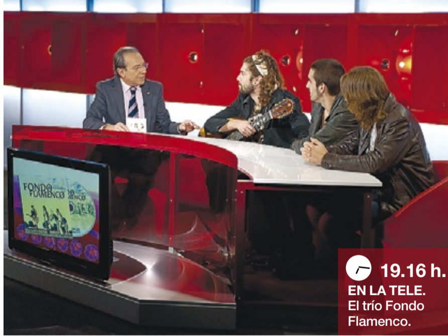
19.16 h. EN LA TELE. El trío Fondo Flamenco.