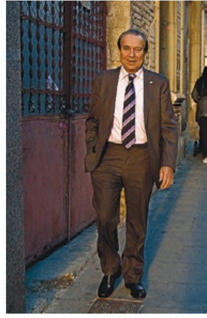
15.24 h. ALMUERZO. Con miembros del equipo.