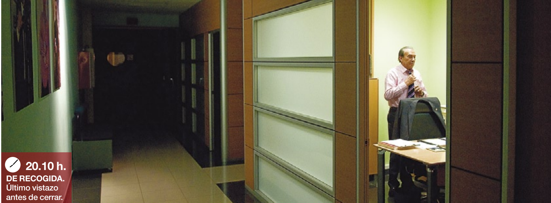
20.10 h. DE RECOGIDA. Último vistazo antes de cerrar.